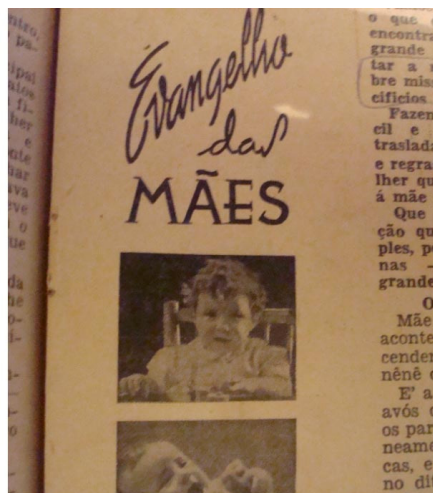
Fig 5. Vida e Saúde, São Paulo. n° 4, ano 11, maio de 1949