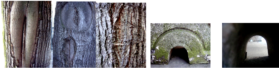
Fotos 5, 6, 7, 8 e 9: Rosana Bortolin (2009) Fonte das imagens: própria.

(2000), em seu livro "O visível e o invisível". A observação do meu entorno, seja ele cidade ou natureza, resulta numa fonte de possibilidades de vivências e, posteriormente, na análise de formas. Observei várias fendas, brechas, orifícios e formas semelhantes (fotos 5, 6, 7, 8 e 9) que funcionaram como um diálogo entre meu corpo atual e a imagem poética. Minha forma de habitar o mundo é esta vivência com o entorno, mesmo em trânsito, ora na cidade ora na natureza, ora num avião, num trem, num carro ou num ônibus sob diversas vias.